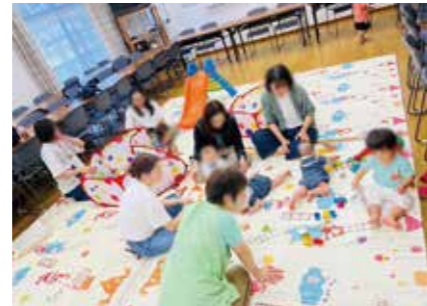
■ 名瀬第二町内会館での楽しい親子教室