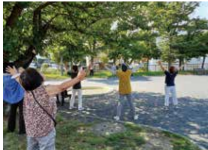
■ 名瀬町第一公園、名瀬下第一公園(スポーツ公園)、名瀬下第三公園で実施