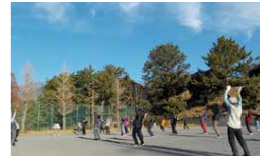
■ ラジオ体操で健康づくり(名瀬下第一公園での様子)