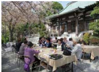
■ 妙法寺の素敵な環境の中で楽しむ、仲間づくりの場