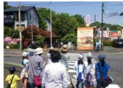
■ 里山を歩き、ゴールでは豚汁と焼きそばで多世代交流