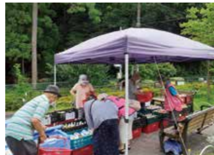
■ 地域の企業の協力を得て、買い物をサポート