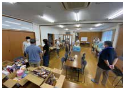
■ 年2回、地域の方の温かさと一緒に届けるイベントとして定着