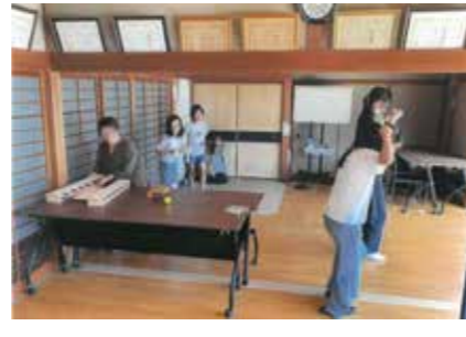
■ 赤ちゃんから高齢者の方まで、昔遊びで多世代交流