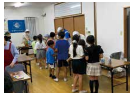
■ 子どもから高齢者まで、おいしい食事で笑顔いっぱいの居場所づくり