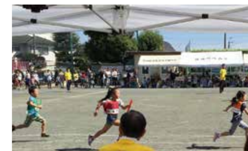
■ レクリエーション大会

地域ボランティアによる小学1年生を対象とした「むかしあそびの会」や「レクリエーション大会」、「ウォーキング大会」、「川上チャレンジ」、「さわやかスポーツ・ペタンク」などを実施して地域の皆様の世代を超えた親睦と健康づくりの活動を行います。