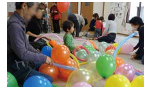
■ 「ぶらんこ」風船あそび

子育てサークル「ぶらんこ」による未就園児の子育て支援や学援隊による登下校時の学童見守り活動などを実施します。また一人暮らしの高齢者親睦会「若葉会」、ふれあいサロン「ひまわり」、「男の料理教室」、「社会を明るくする運動川上地区の集い」などを実施し、支え合うまちづくりを継続し発展させます。