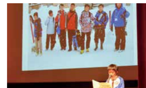
■ 下川町での「冬の体験キャンプ」報告会

SDGsの取組で第1回ジャパンSDGsアワードの内閣大臣賞を受賞している北海道下川町と友好交流協定を結んでいる川上地区連合町内会は下川町との交流事業を通じて独自のエコ活動を実施して来ました。今期も取組を継続するとともに「SDGs」の17の目標とも連動した活動に取り組めます。