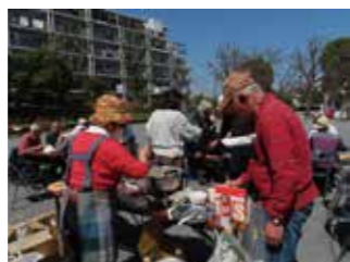
■ 多世代交流サロン