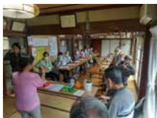
■ 木曜会 複数箇所開催に

高齢者向け食事会の各所開催、多世代交流サロンの開催など支え合いの輪を広げました。また、町内会単位での防犯活動や、地域防災拠点訓練などの防災活動を実施し、助け合いによる安全・安心の街づくりをしてきました。