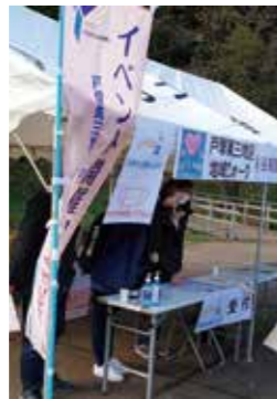
■ コロナ期の地域ウォーク