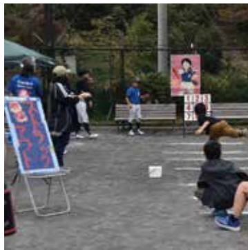
■ 地域団体と連携したスポーツフェスティバル

地域で活動する団体との連携や、コロナ期にも健民体育祭に替わる地域イベント開催により地域のつながりを保つなど連携の確保、強化に努めました。