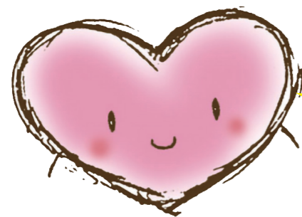
도쓰카 하트 플랜 마스코트 <COCORON>