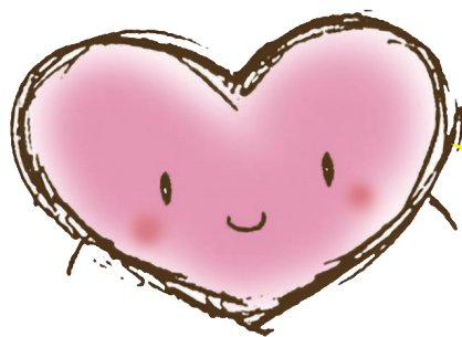
とつかハートプラン マスコット「こころん」