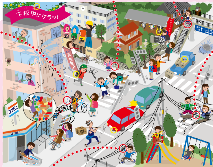
まいろ 黄色の○にわらじがかかれているよ。

かんぱん 看板やガラスの は へん 破片も降ってくる! あし もと 足元も気を付けて!!