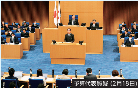
予算代表質疑 (2月18日)

令和8年第1回市会定例会が、1月28日から3月24日まで開催されました。(2面及び3面に、予算代表質疑及び予算関連質疑の一部を掲載しています)