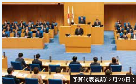
予算代表質疑(2月20日)

令和6年第1回市会定例会が、1月30日から3月26日まで開催されました。(2面及び3面に、予算代表質疑及び予算関連質疑の一部を掲載しています)