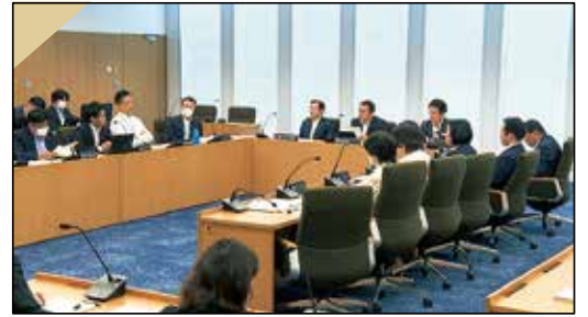
大都市行財政制度特別委員会(令和5年6月7日)

市会の委員会は、大きく分けて3種類。そのうち、条例で常設され所管事項が決まっている常任委員会に対して、特別委員会は特定の問題の調査・審査を行うために、必要に応じて本会議で議決し、設置されます。市政に係る様々なテーマや、予算、決算の審査のために設置される場合などがあります。