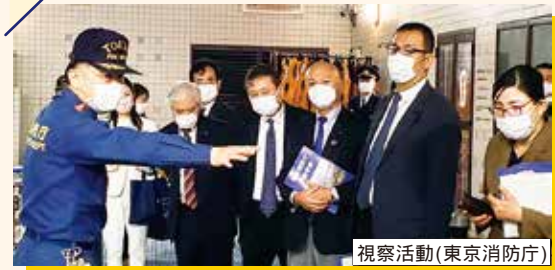
視察活動(東京消防庁)

また、第2回~4回の定例会では、本会議で「一般質問」を行い、市政全般について市長などと議論するなどします。