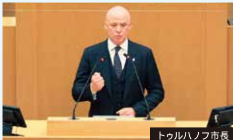
トゥルハノフ市長