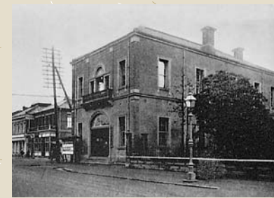
明治22年当時の市役所

明治21年（1888年）に「市制」という法律が制定されました。「市制」は翌明治22年4月1日に施行され、この日、横浜市を含む31の「市」が誕生