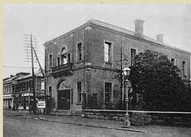
明治22年当時の市役所

明治21年(1888年)に「市制」という法律が制定されました。「市制」は翌明治22年4月1日に施行され、この日、横浜市を含む31の「市」が誕生