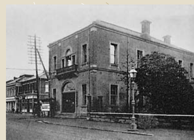
明治22年当時の市役所

明治21年(1888年)に「市制」という法律が制定されました。「市制」は翌明治22年4月1日に施行され、この日、横浜市を含む31の「市」が誕生