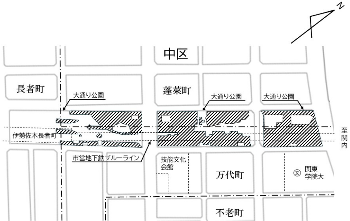
特定公園施設取得位置図