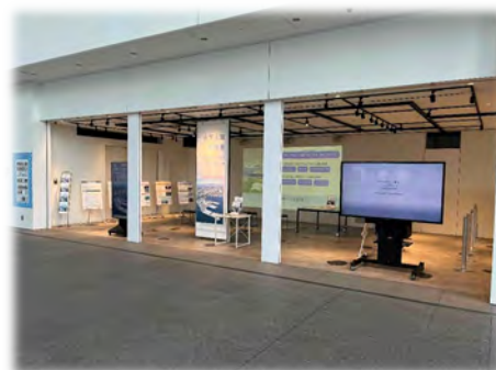
プレゼンテーションスペース