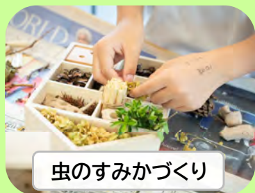
楽しむ・チャレンジする