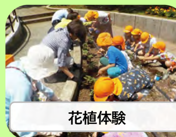
みんなでやってみる