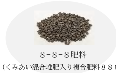
8-8-8肥料 (くみあい混合堆肥入り複合肥料888)

再生リン入り肥料（8-8-8肥料 ※1 ）が令和6年8月26日に肥料登録 ※2 され、試験製造がスタートしました。9月末にこれを用いた試験栽培にご協力いただける農家や市内公園等の関係各所に配付し、肥料利用を始めましたので、進捗状況について報告します。