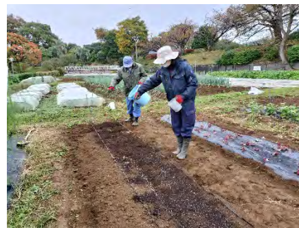
本市のほ場（環境活動支援センター）での施肥の様子

また、JA横浜の野菜部に所属する農家全員に対し、取組内容を周知し、再生リン入り肥料を提供する等、普及・啓発を進めています。