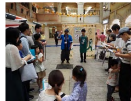
トレッサecoイベントの様子