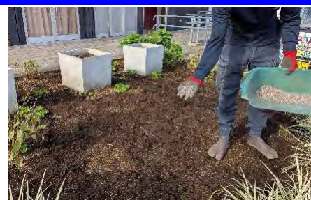
ウェルカムガーデン（里山ガーデン）での施肥の様子

また、里山ガーデンでは、春の里山ガーデンフェスタに向けた準備として、ウェルカムガーデン内の花壇への再生リン入り肥料の施肥を11月に行いました。