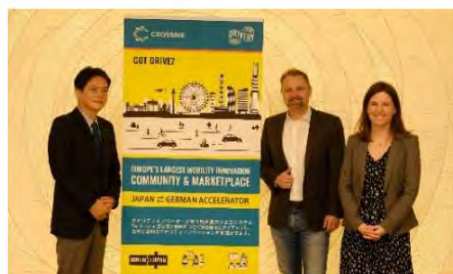
ドイツのモビリティ関連イノベーション拠点 「The Drivery」との連携（市庁舎にて4年12月面会）