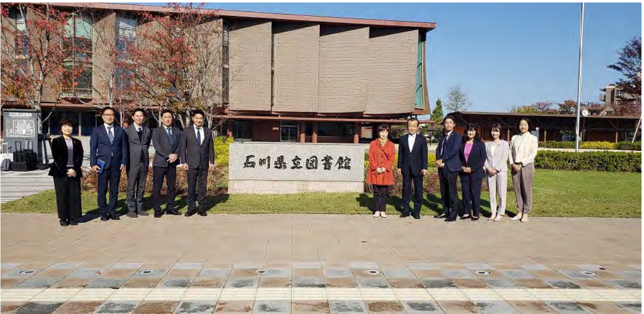
(石川県立図書館入口にて)