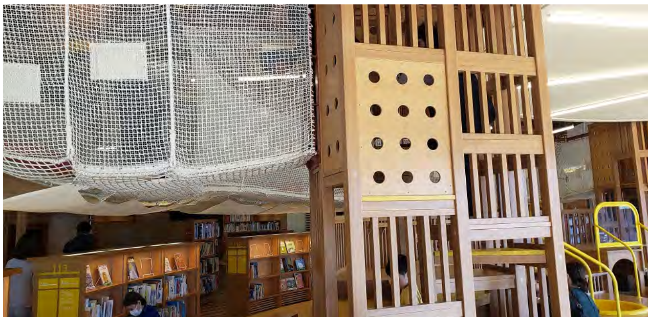
(こどもエリアのアスレチック)

また、こどもエリアに隣接した屋外に、里山をイメージした「おはなしの森」があり、植物や昆虫の観察会や、サツマイモ等の農作物の収穫体験等も行うことが可能となっており、本も活用しながら生きた知識を学ぶことが出来る。