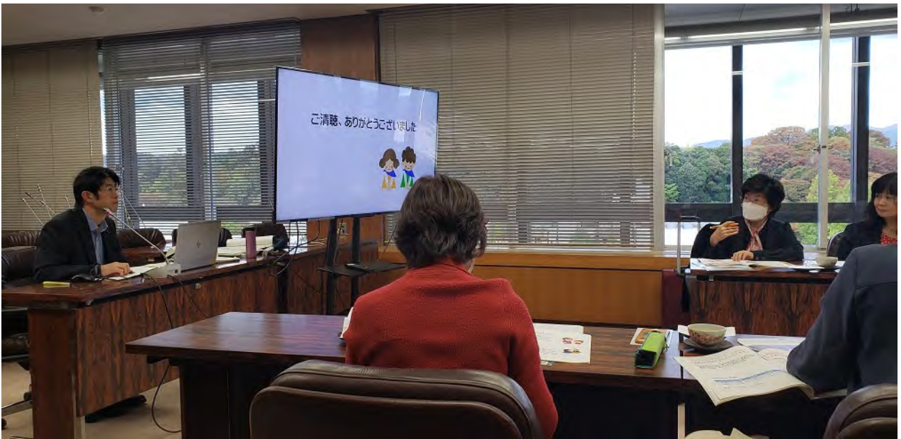
(金沢市議会にて説明聴取及び質疑)