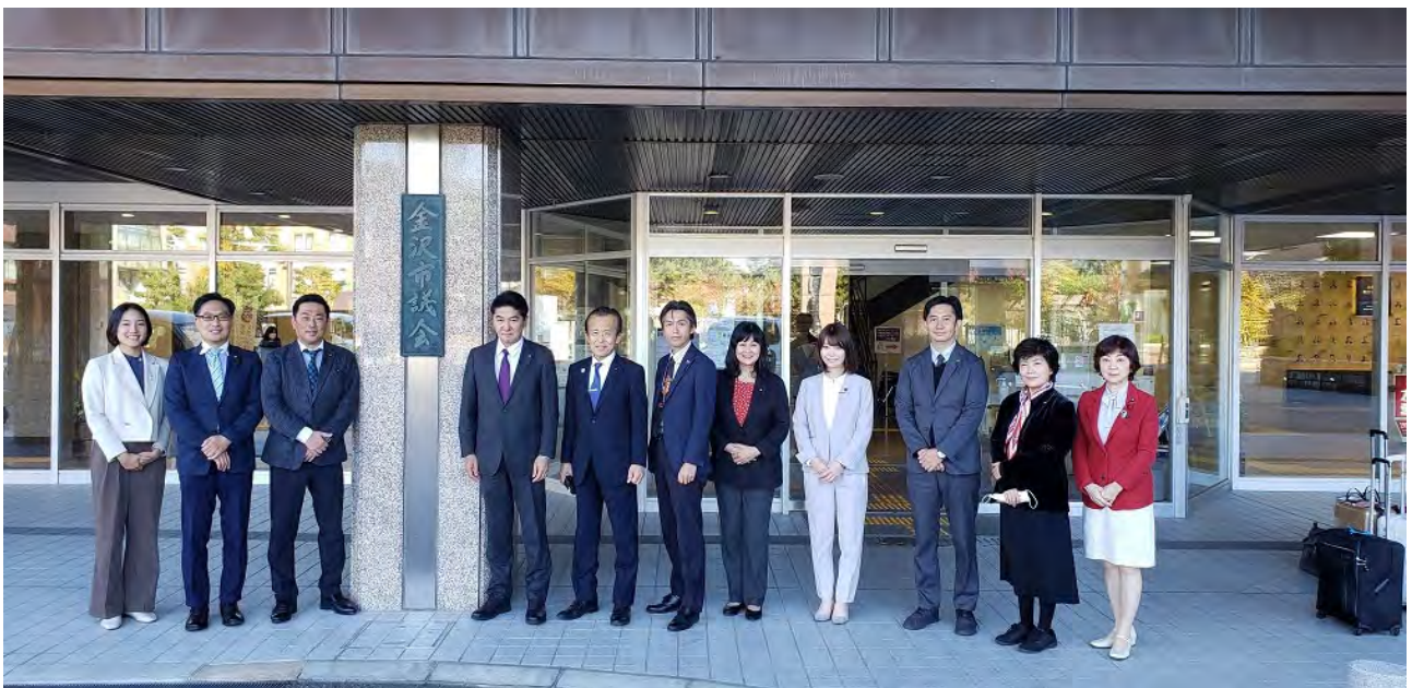
(金沢市議会入口にて)