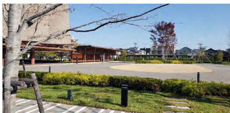
(広大なロータリー)