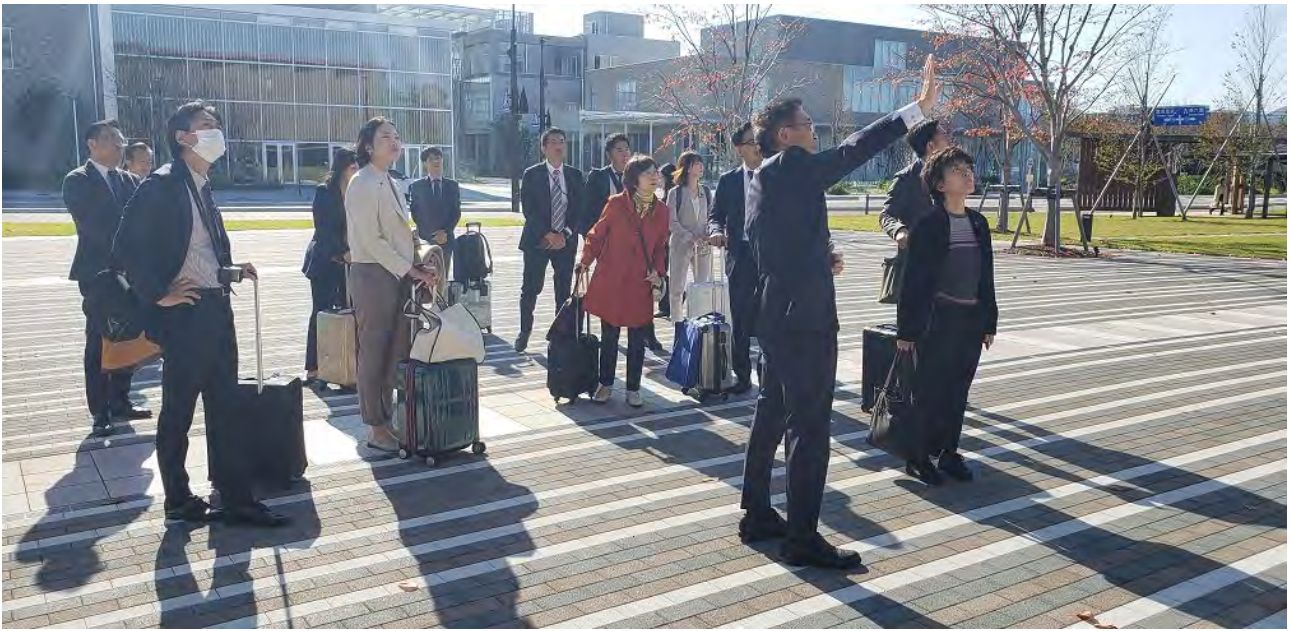
(石川県立図書館前にて説明聴取及び質疑)