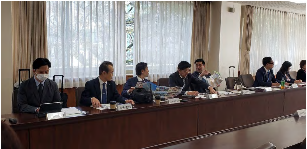
(福井県議会にて説明聴取及び質疑)