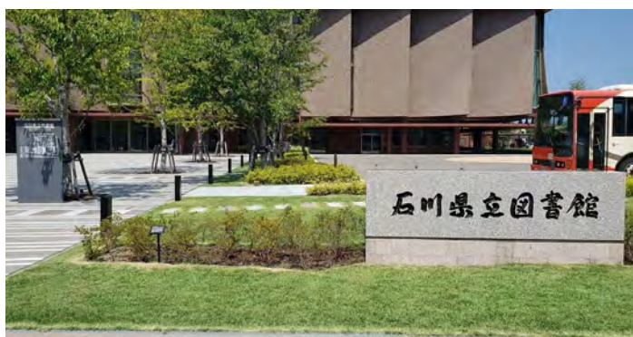
(正面玄関と屋外広場)

図書館は敷地全体の中央に配置され、その周囲三方を緑地に包まれた駐車場が取り囲んでおり、周辺の景観にも配慮している。また、建物の正面には、桜並木のある屋外広場やバスやタクシーの乗降可能な広大なロータリーも設けられ、公共交通機関等での来館者を出迎えられるようになった。