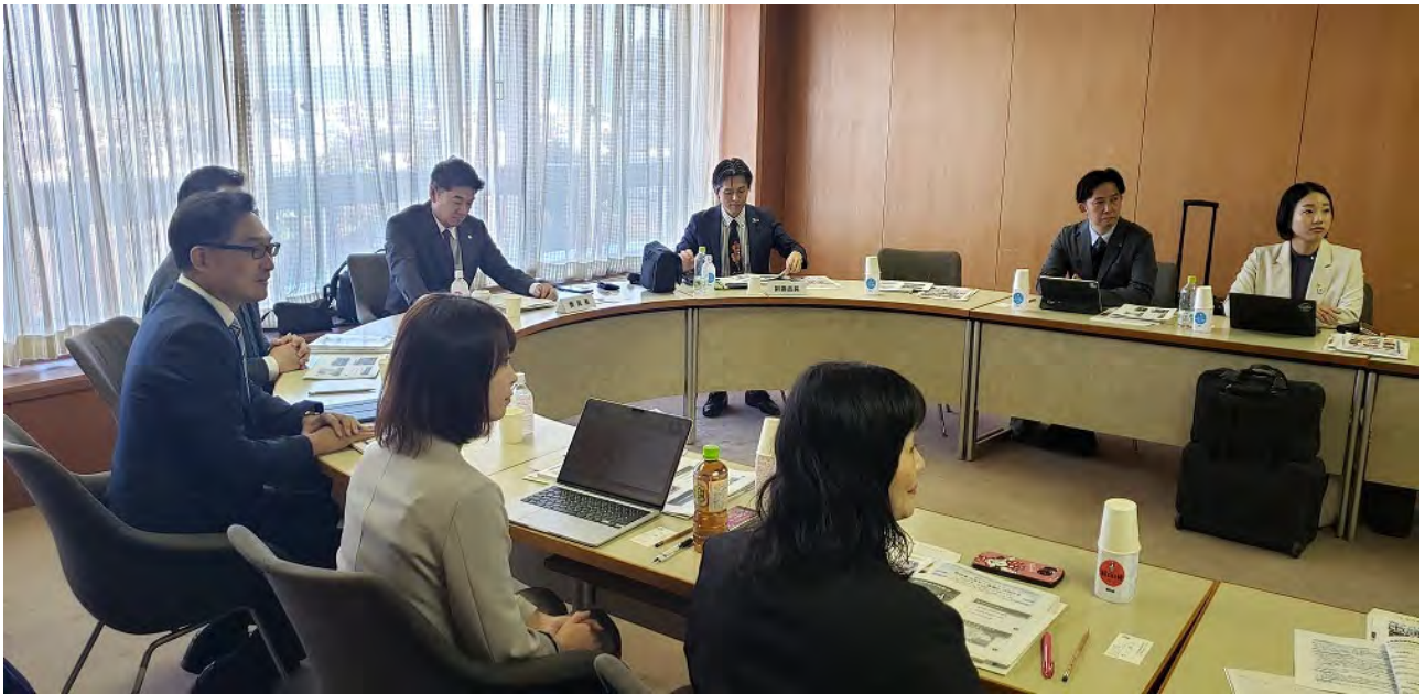
(福井市議会にて説明聴取及び質疑)