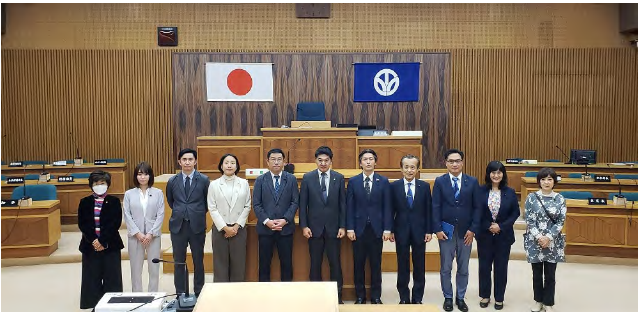
(福井県議会本会議場にて)