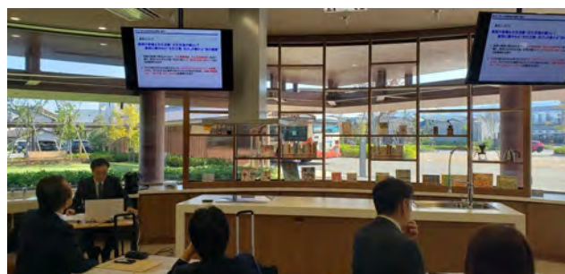
(食文化体験スペース)