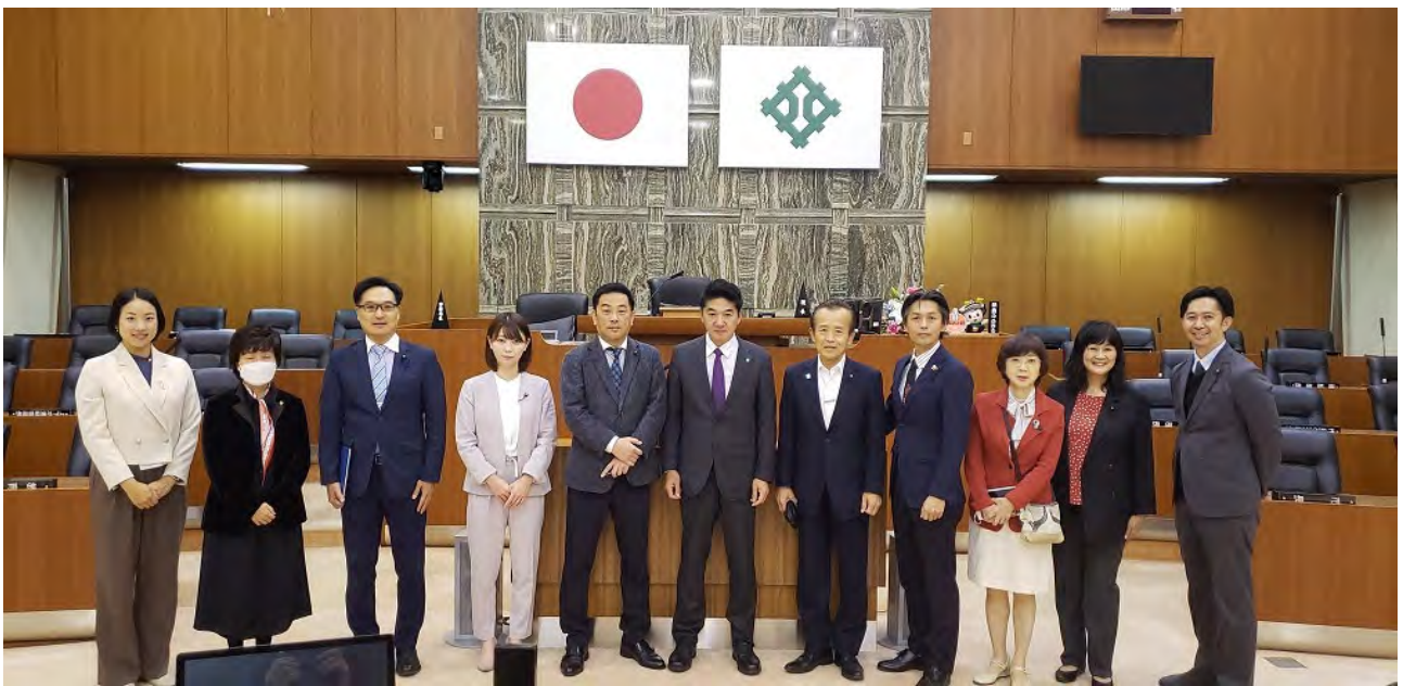
(福井市議会本会議場にて)