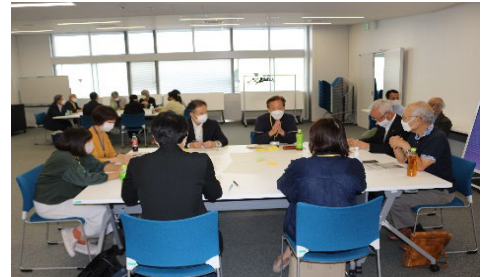
②意見交換の様子（港南区）