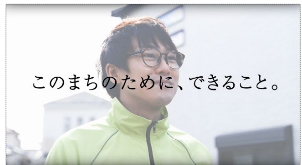
デジタルサイネージ用動画 (15 秒 CM)

地域における良好な環境や地域の価値を維持・向上させるための、住民・事業者・地権者等による主体的な取組を行う組織