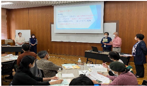
①講座「実践者から学ぶ」の様子（鶴見区）