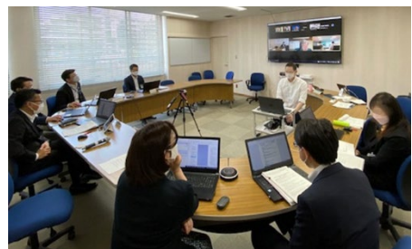
（2）区連会リモート開催の様子（西区）