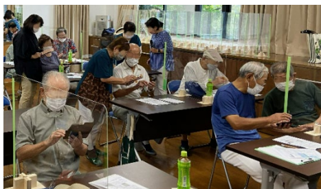
（1）自治会町内会向けLINE使い方講座の様子（港南区）