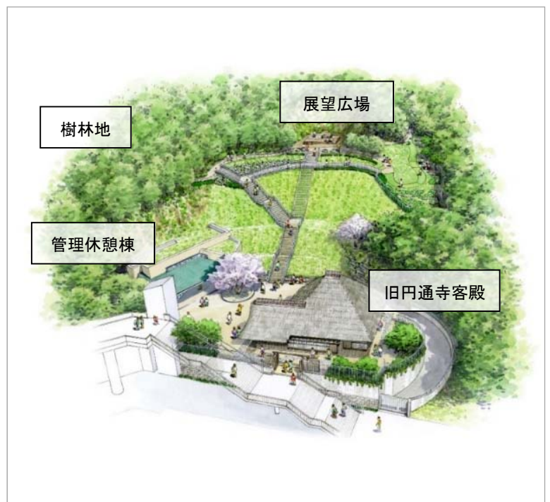
【図3】金沢八景権現山公園 整備イメージ図