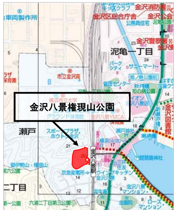
【図1】金沢八景権現山公園 位置図