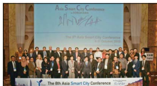
第8回アジア・スマートシティ会議の様子