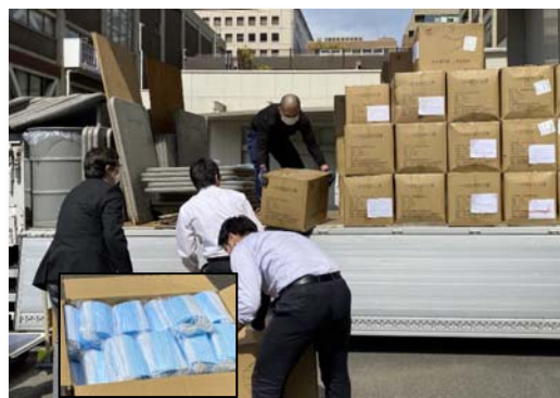
上海市人民政府の協力の下、調達したマスク