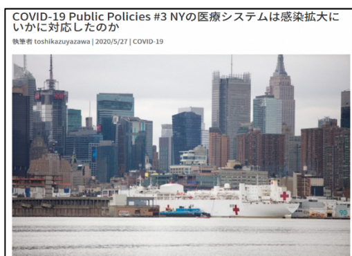
米州事務所ウェブサイトにおける NY州・市の現地情報レポート

また、神奈川新聞においても「コロナ禍の世界 横浜市駐在員レポート」と題して、23 回にわたり寄稿しました（令和 2（2020）年 11 月 12 日時点）。