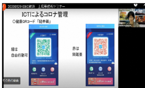
オンラインセミナーでの説明の様子 （上海事務所）

また、持続可能な都市づくりの実現に向けた知見の共有と、市内企業のインフラビジネス展開支援を目的として毎年開催している「アジア・スマートシティ会議」については、令和2（2020）年度はみなとみらい21地区での実開催とウェブ開催のハイブリッド形式での開催に向けて準備を進めています。