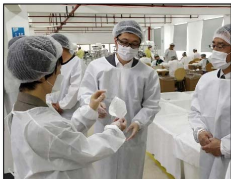
上海事務所による生産現場の確認