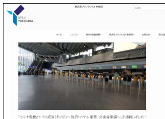
フランクフルト事務所ウェブサイトにおける 現地情報レポート