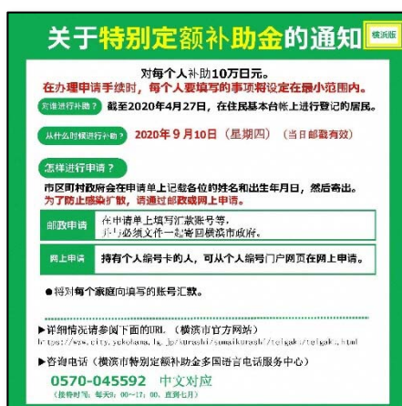
特別定額給付金 中国語（簡体）版リーフレット

また、18区へのタブレット等通訳機器及び翻訳機器の配備を実施し、相談対応を強化しています。