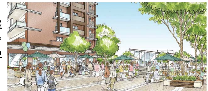
広場空地のイメージ

※HEMS:ホーム・エネルギー・マネジメント・システム(Home Energy Management System)の略称。 住戸内の電気量等のエネルギーの使用量が確認できるシステムのこと。