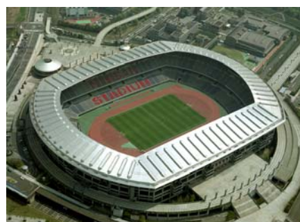
<横浜国際総合競技場>