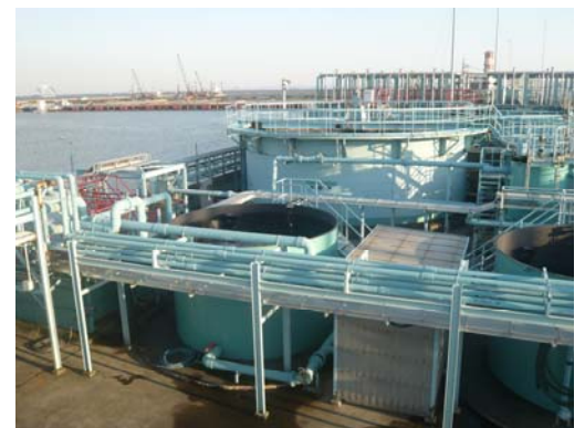
《参考》南本牧処分場排水処理施設

なお、これらの設備は、通常時は使用せず、万が一、流入水中のセシウム濃度が上昇した場合に稼働します。