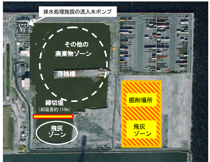
《図－ 2》 飛灰埋立ゾーン

飛灰の埋立ゾーンを設けることにより、放射性セシウムの溶出防止対策を効果的に実施することが可能となります。