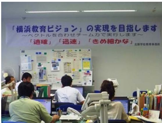
【北部学校教育事務所】

平成20年度に先行して市内4方面別に「授業改善支援センター（ハマ・アップ）」を開設しましたが、平成21年度は市内4方面の「方面別学校教育事務所」の開設準備を進め、平成22年4月1日に東西南北の各方面別学校教育事務所を開設しました