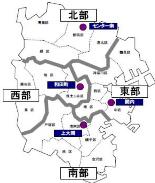
【学校教育事務所の配置】