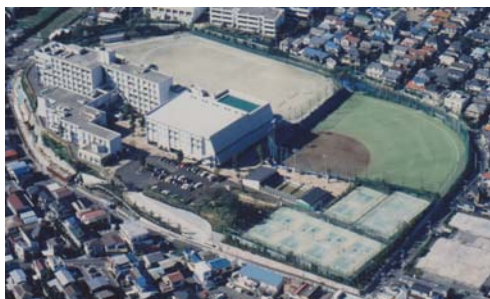
【中高一貫教育校を開設する南高校】

平成 21 年度は、「 横浜市立中高一貫教育校の設置に関する基本方針 」を策定し、平成 24 年度、 南高等学校に附属中学校を設置 し、併設型の中高一貫教育校として開校することを決定いたしました。