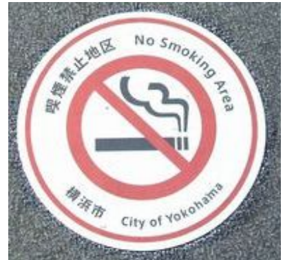
図3：路面表示サイン