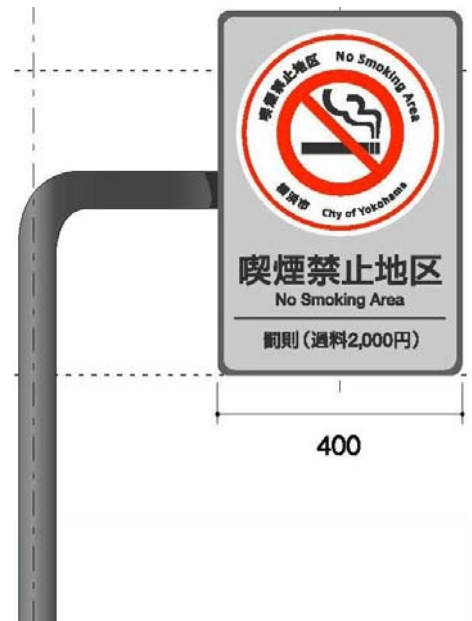
図6：道路標識タイプ表示