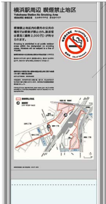
図1：4か国語併記の大型看板