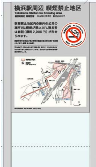
図2：英語併記の小型看板