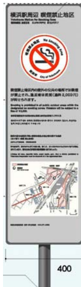
図5：4か国語併記の新型看板