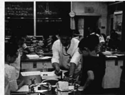
中学校理科室で中学校教諭による6年の理科の授業