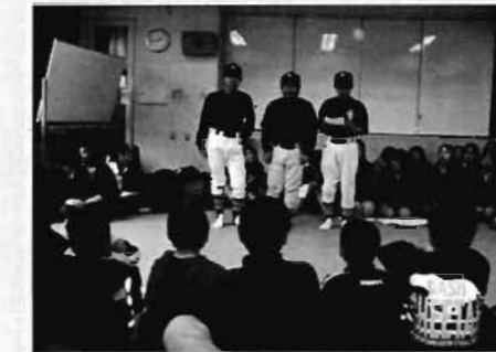
中学生による小学6年生への部活動紹介