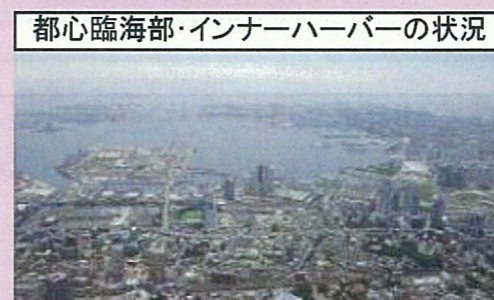
都心臨海部・インナーハーバーの状況