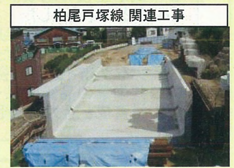
柏尾戸塚線 関連工事