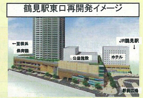
鶴見駅東口再開発イメージ