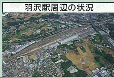
羽沢駅周辺の状況