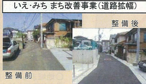
いえ・みち まち改善事業(道路拡幅)