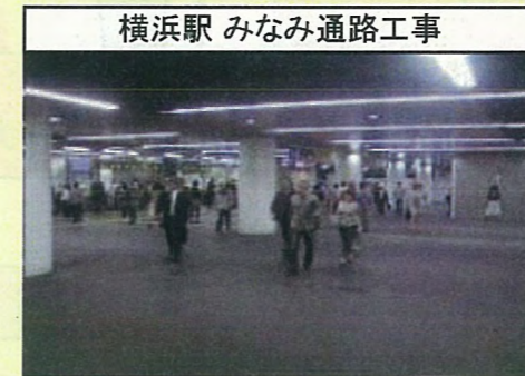
横浜駅 みなみ通路工事