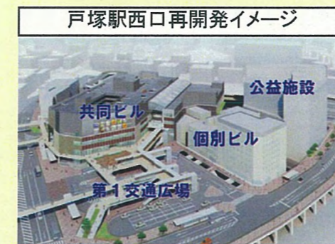
戸塚駅西口再開発イメージ