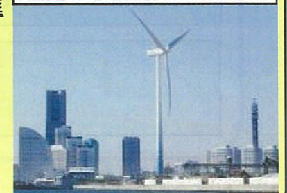
ハマウイング&みなとみらい