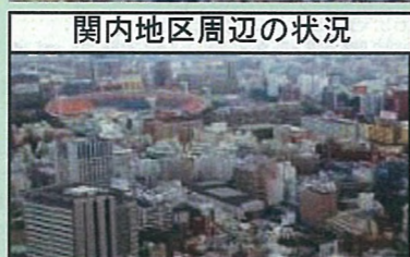
関内地区周辺の状況