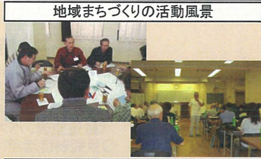
地域まちづくりの活動風景