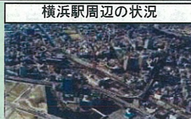
横浜駅周辺の状況