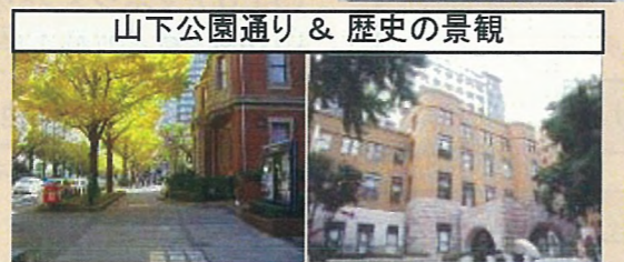
山下公園通り & 歴史の景観