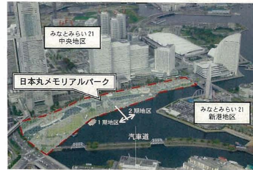
日本丸メモリアルパークの位置