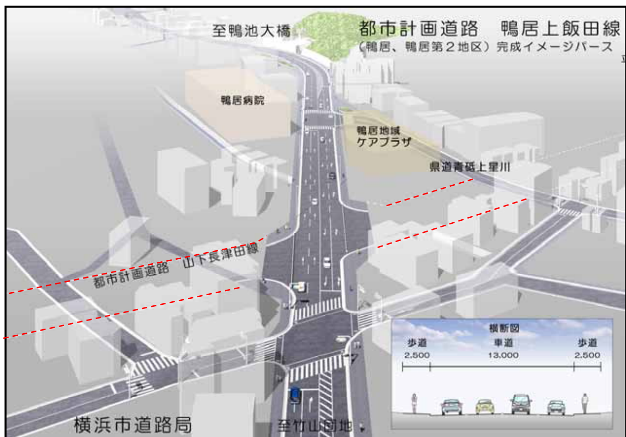
(竹山団地側上空から俯瞰したイメージパース)