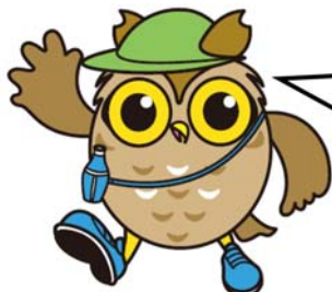
瀬谷区マスコットキャラクター せやまる

～瀬谷ふるさと歴史さんぽ道ガイドマップを配布しています～ さらに「ウォーキングせやまるグッズ」プレゼント