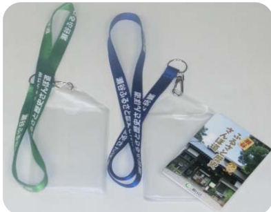
▲ガイドマップがすっぽり入る ネックストラップ!