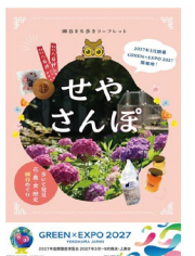
瀬谷まち歩きリーフレット「せやさんぽ」