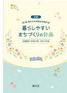
「暮らしやすいまちづくりの計画～第5期瀬谷区地域福祉保健計画」