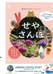
瀬谷まち歩きリーフレット「せやさんぽ」