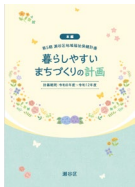
「暮らしやすいまちづくりの計画～第5期瀬谷区地域福祉保健計画」