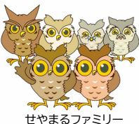
せやまるファミリー

日頃から職員がお互いを気につけ合 える関係を築きながら、区民の皆様 一人ひとりの声に耳を傾け、寄り添 った支援をします。