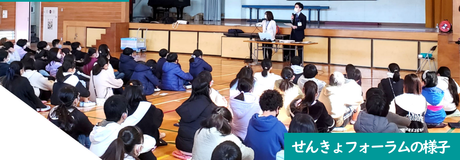
せんきょフォーラムの様子