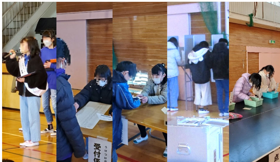
左から「候補者演説」、「受付係」、「投票用紙交付係」、 「投票用紙記入」、「開被分類作業」体験の様子

候補者の熱い演説を聴いて、児童の皆さんが真剣に悩んで投票されている姿が印象的でした。