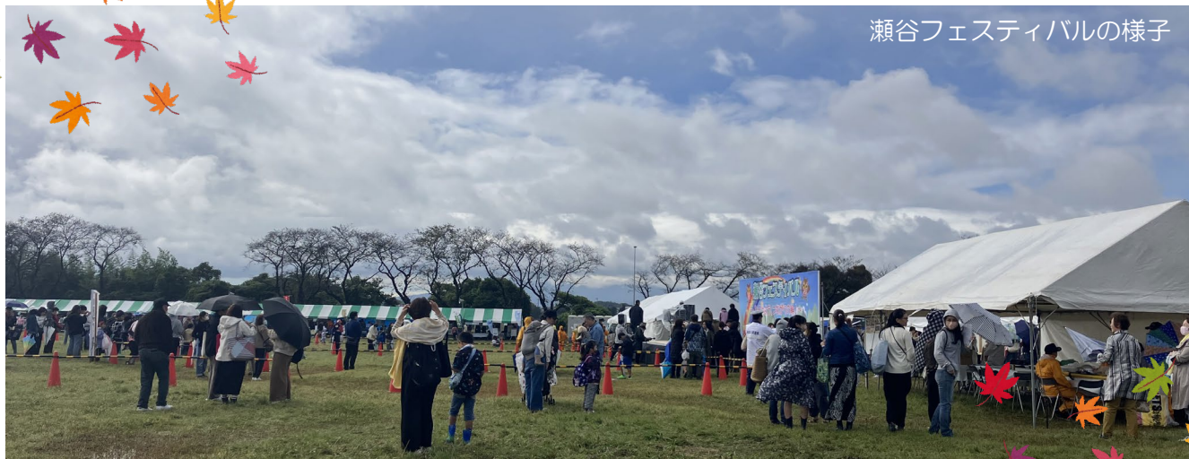
瀬谷フェスティバルの様子