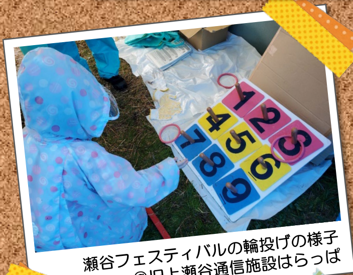
瀬谷フェスティバルの輪投げの様子 @旧上瀬谷通信施設はらっぱ