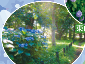
宮沢ふれあい樹林