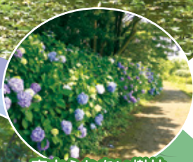
東山ふれあい樹林