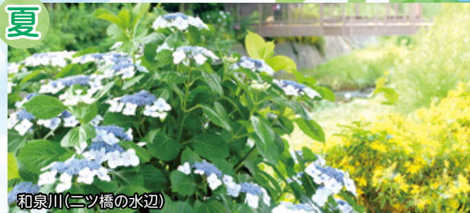
和泉川(二ツ橋の水辺)