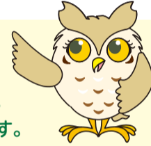
せやまるの おかあさん

幅広い世代を対象とした防災意識啓発による地域防災力の向上や災害時医療体制の強化を図ります。また、防犯・交通安全意識の啓発・向上やグリーン社会の実現に向けた普及・啓発の取組を推進します。