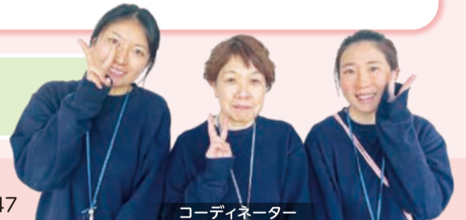
コーディネーター

子育てする人を応援したいけど何から始めたらよいのか悩んでいる人は子育てサポートシステム瀬谷区支部までお電話ください。