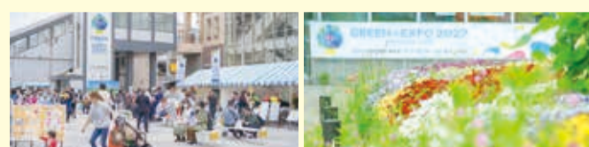
カウントダウンイベントの様子