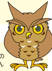
せやまるの おとうさん