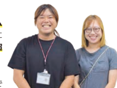
瀬谷第二学童保育クラブの 指導員さん

最大の魅力は、仲間とのチーム ワークが深まること。強い上級生に 憧れて頑張る子どもも多く、学年を超 えたつながりが生まれます。 勝ったときの達成感はもちろん、 負けるのも貴重な経験に。みんなで 作戦を練ることで、自分たちで考え る力も養われています。