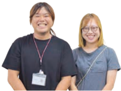
瀬谷第二学童保育クラブの指導員さん

勝ったときの達成感はもちろん、負けるのも貴重な経験に。みんなで作戦を練ることで、 自分たちで考える力 も養われています。