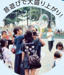
昔遊びで大盛り上がり！