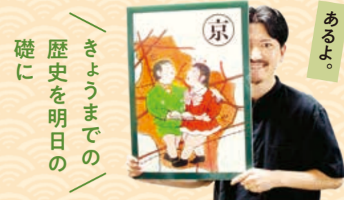
でかいかるたも あるよ。 きょうまでの 歴史を明日の 礎に

瀬谷の歴史を知るとは、 瀬谷に住む自分を知ることでもある。 郷土瀬谷への愛着や理解を深め、 私たちの歴史を築こうではありませんか。 （京の札解説より抜粋）