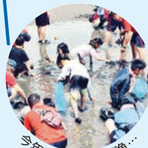
今年は無念の大不漁...