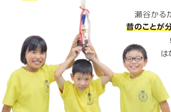
インタビューに答えてくれたこどもたち