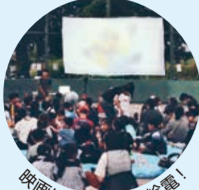
映画は自動車から給電！