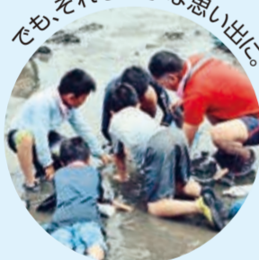
でも、それも大事な思い出に

普段できない体験に、 みんなで挑戦しよう。 貸切バスで 瀬谷を飛び出し、 野島公園で 潮干狩り！