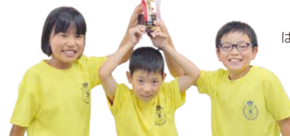
インタビューに答えてくれたこどもたち

早く取るコツは、文字で はなく、絵だけで覚えること。 優勝しないことは考え ていません。 絶対負けたくないぞ！