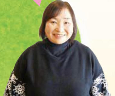
区主任児童委員*連絡会