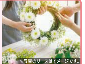
※写真のリースはイメージです。