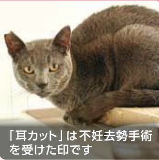
「耳カット」は不妊去勢手術を受けた印です

飼い主のいない猫が増えると、ふん尿被害など、地域でのトラブルの原因となってしまう。飼い主のいない猫を増やさないためにできることや、トラブルを減らすお世話の仕方を考えてみましょう。