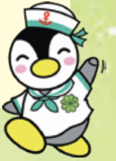
民生委員・児童委員キャラクター「よこはまミンジー」