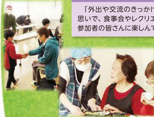
高齢者向けのお食事会

「外出や交流のきっかけにしてほしい」との思いで、食事会やレクリエーションを企画し、参加者の皆さんに楽しんでいただいています。