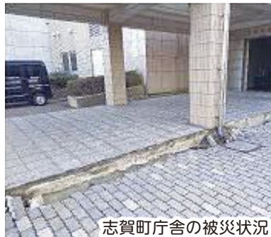
志賀町庁舎の被災状況

私たちは、それぞれ第6次支援隊(2月15日~22日)、第7次支援隊(2月22日~29日)として、石川県志賀町に派遣されました。志賀町庁舎周辺は建物の周りが隆起したり、電柱が50cmほど沈んだりするなど、能登半島地震の威力のすさまじさを目の当たりにしました。