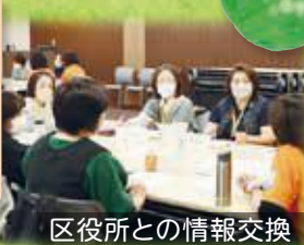
区役所との情報交換

活動に必要な知識の幅を広げると同時に、私たち自身が笑顔で活動できるよう、民生委員の仲間同士の交流も大切にしています。