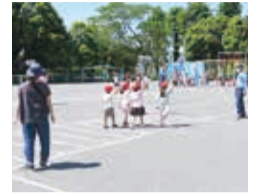
はまっこ交通安全教室