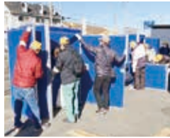
地域防災拠点訓練