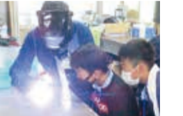
せやっこわくわくワーク