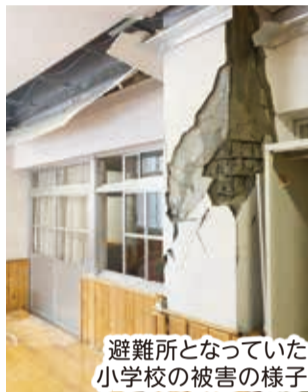
避難所となっていた小学校の被害の様子

いただいたカードの中には、避難生活で感じたつらい心情や、切実な訴えが書かれたものもありました。