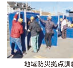
地域防災拠点訓練