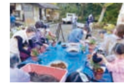
区民向けイベントの様子