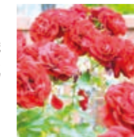
瀬谷オープンガーデン