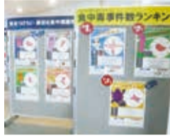
食中毒予防キャンペーン