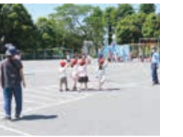
はまっこ交通安全教室