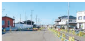
都市計画道路の整備状況 (2023年12月撮影)

三ツ境駅側の第1期地区(約4.1ヘクタール)は、建物の移転補償及び道路等の都市基盤施設の工事を進めます。また、第2期以降の地区は、事業計画案の作成や地権者の皆さんへの説明を行うなど、事業化に向けた取組を進めます。