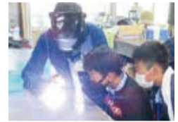
せやっこわくわくワーク