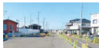
都市計画道路の整備状況 (2023年12月撮影)

ニツ橋駅側の第1期地区(約4.1ヘクタール)は、建物の移転補償及び道路等の都市基盤施設の工事を進めます。また、第2期以降の地区は、事業計画書の作成や地権者の皆さんへの説明を行うなど、事業化に向けた取組を進めます。