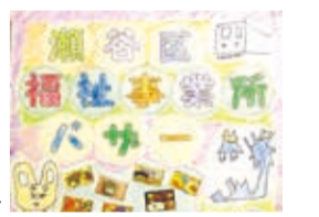
障害福祉事業所バザー