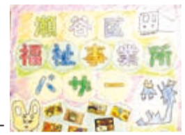
障害福祉事業所バザー