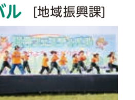
瀬谷フェスティバル

地域への愛着心とふるさと意識を高めることを目的に、瀬谷フェスティバルを開催します。