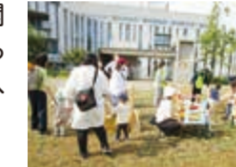
子育て応援イベントの様子