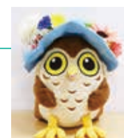
瀬谷区マスコットキャラクター「せやまる」

職員への応対研修や区民ボランティアによるフロア案内、広報・広聴の充実などを通じて、区民サービスを向上していきます。また、来庁者に快適で安全に過ごしていただけるよう、区庁舎の環境を整備します。