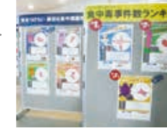
食中毒予防キャンペーン