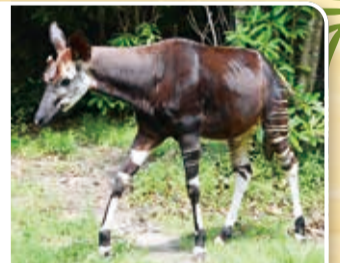
艶やかな体をしています

ズーラシアは日本初のオカピの飼育・公開を始めた動物園で、繁殖にも成功しています。現在はオス2頭、メス1頭を飼育し、再び繁殖を目指しています。毎日14時30分からは「飼育員のとおきタイム(ガイド)」を開催しており、葉っぱを食べる様子を観察できます!