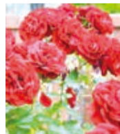
瀬谷オープンガーデン