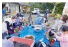
区民向けイベントの様子