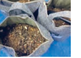
生ごみ堆肥化の様子