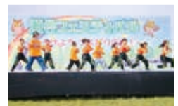
瀬谷フェスティバル

地域への愛着心とふるさと意識を高めることを目的に、瀬谷フェスティバルを開催します。