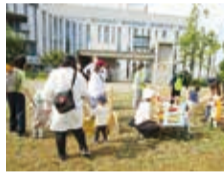
子育て応援イベントの様子