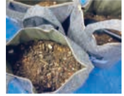
生ごみ堆肥化の様子