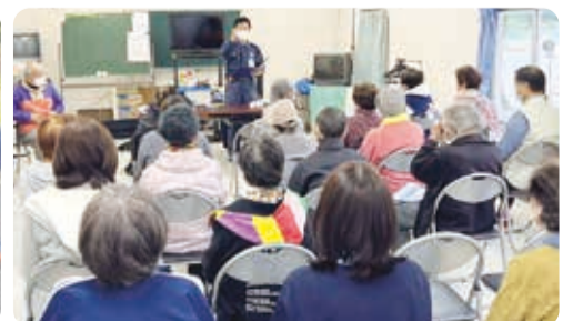
阿久和住宅自治会での消火訓練・講習会の様子

防災訓練はお住まいの地域の自治会・町内会等で計画・実施していますので、確認してみましょう。