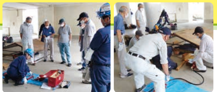
ジャッキの使用訓練の様子