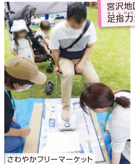
さわやかフリーマーケット

活動を企画して、地域の皆さんに「楽しかった」「ためになった」と喜んでもらえるのがやりがいを感じます。地域で見かけたときは、ぜひ「保活さん」と呼んでくださいね！