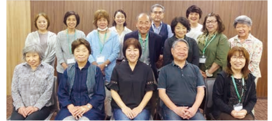
地区の会長・副会長 集合写真