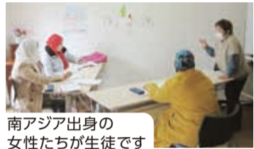
南アジア出身の 女性たちが生徒です