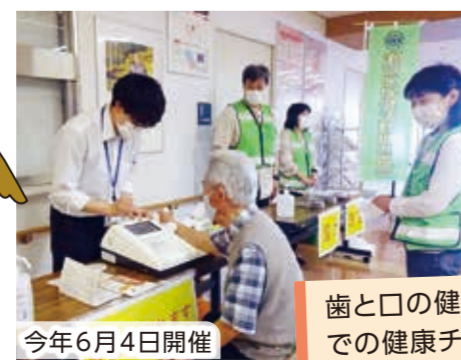
歯と口の健康週間 での健康チェック