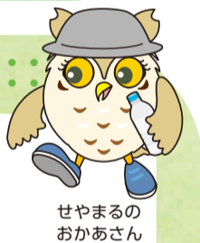
せやまるのおかあさん