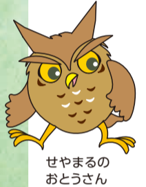
せやまるのおとうさん