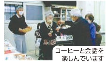
コーヒーと会話を 楽しんでいます

学校の教室を借りて、高齢者が集うサロンを開いています。活動の土台となっているのは、地元ソフトボールチームのつながりと、地域の皆さんのチームワークです。代表を続けてもう10年以上経ちますが、地元から頼まれたら断れません(笑)。地元が一番大事ですね。