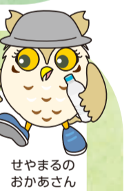
せやまるのおかあさん