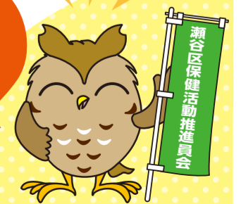
瀬谷区保健活動推進委員会