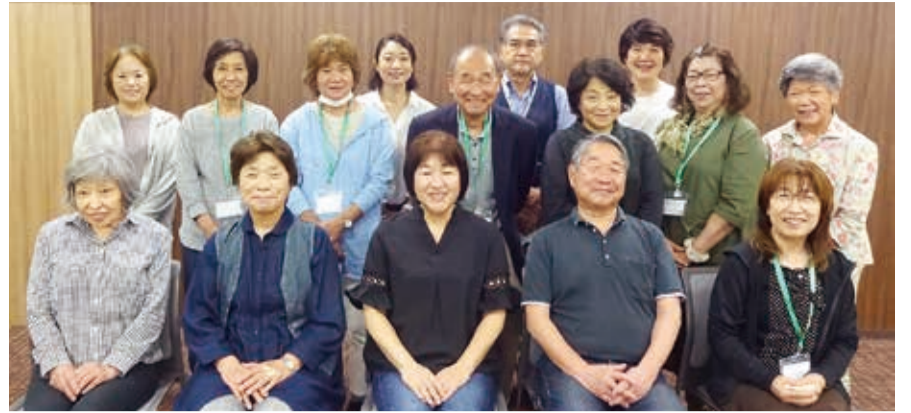
地区の会長・副会長 集合写真