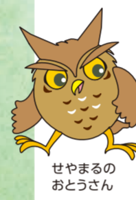
せやまるのおとうさん