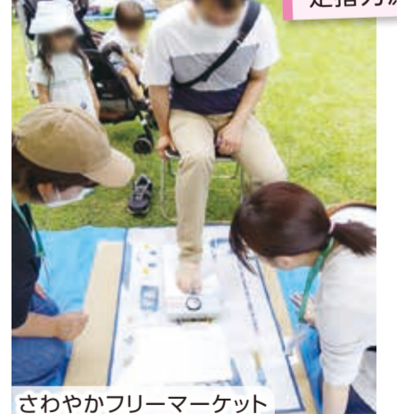
さわやかフリーマーケット

活動を企画して、地域の皆さんに「楽しかった」「ためになった」と喜んでもらえるやりがいを感じます。地域で見かけたときは、ぜひ「保活さん」と呼んでくださいね!