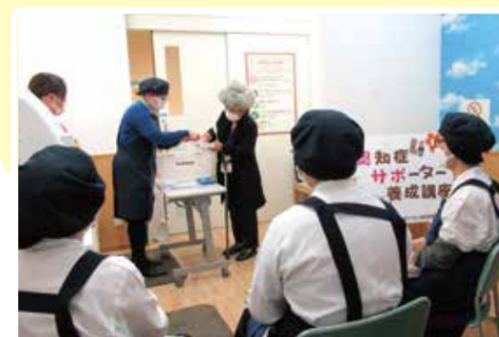
区内企業での認知症サポーター養成講座の様子

認知症サポーター養成講座を開催したい場合は区役所高齢者支援担当または地域包括支援センターに相談してね。