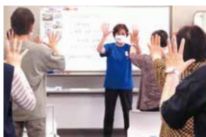
手足を動かす脳トレからスタート