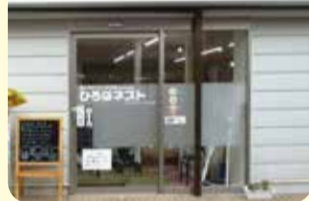
三ツ境駅から徒歩5分

「ひろばネスト」は、子育て中の親子がゆっくりくつろぐことができる広場です。子どもを遊ばせながら、気軽に子育ての悩みも相談できます。また、親子の交流ができるイベントや地域の子育て情報もたくさんあります。