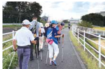
景色を楽しみながら歩きます

ポールウォーキングなどを主催しています。運動を続けると、皆さん姿勢がすっとよくなり、はつらつとしてきます。そんな変化がうれしくて、自分の栄養になっています。運動って、ただ体を動かすだけではないですね。仲間ができて、対話が生まれ、つながり合うことで人生がもっと楽しくなります。これからも続けていきますよ。