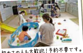
初めての人も大歓迎!予約不要です。

アットホームで利用者同士がつながりやすく、みんなで一緒に子育てする温かい雰囲気があります。おうちで1人でお子さんと向き合うのに疲れたら、肩の力を抜きに、ぜひ遊びに来てくださいね。プログラムやイベント、混雑状況や日々の様子などをインスタグラムやブログで発信していますので、ぜひご覧ください。