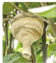
初期のスズメバチの巣

●春先(4月～6月)の初期のハチの巣はとっくりを逆さにしたような形や、シャワーヘッドのような形をしています。初期のハチの巣の場合、自分で駆除できます。駆除方法は生活衛生係までお問い合わせください。