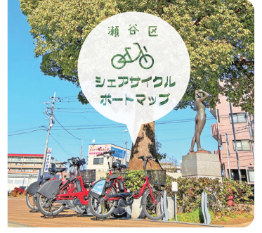
横浜市広域シェアサイクル事業社会実験 baybike (広域)

2027年国際園芸博覧会 GREEN×EXPO 2027 2027年3月19日(金)～9月26日(日)