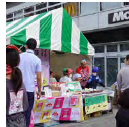
上瀬谷小学校の クッキー販売