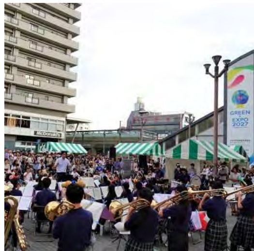
瀬谷中学校の吹奏楽演奏

すっかり定番となった太鼓や吹奏楽の演奏に加え、相撲甚句、ピアノ演奏、楽器演奏、トーンチャイム、合唱、タップダンス、ハワイアンフラ、キッズダンス、ジャズ演奏と幅広いパフォーマンスが続きました。