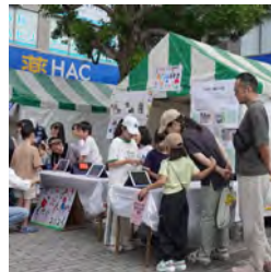
中屋敷地区センターと 大門小学校の苗の配布

テントでは、毎年大人気の鮎の塩焼きや軽食の販売、なりきり駅長コーナー、お肌の測定会、かんたん健康チェックに加え、中屋敷地区センターと大門小学校のみんなが育てた苗の配布や、上瀬谷小学校の手作りクッキー販売もありました。横浜市からウッドストローワークショップ、GREEN×EXPO 2027の展示、シェアサイクル登録キャンペーンなども行われ、笑顔が集まる一日になりました。