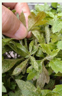
ハダニが付いた菊

(A) 日光に当たりすぎると、菊の葉は黄色に変色してしまい、成長も止まってしまいます。また、鉢を置いた地面が高温になったり、気温も上がりすぎると、菊を痛めます。午前中の数時間日光を当てたら、風通しの良い日かげに移動させましょう。なお、こうした配慮は菊の生育環境に依存します。周囲に他の植物が多くある環境では気温も緩和されます。環境に応じた配慮が必要です。