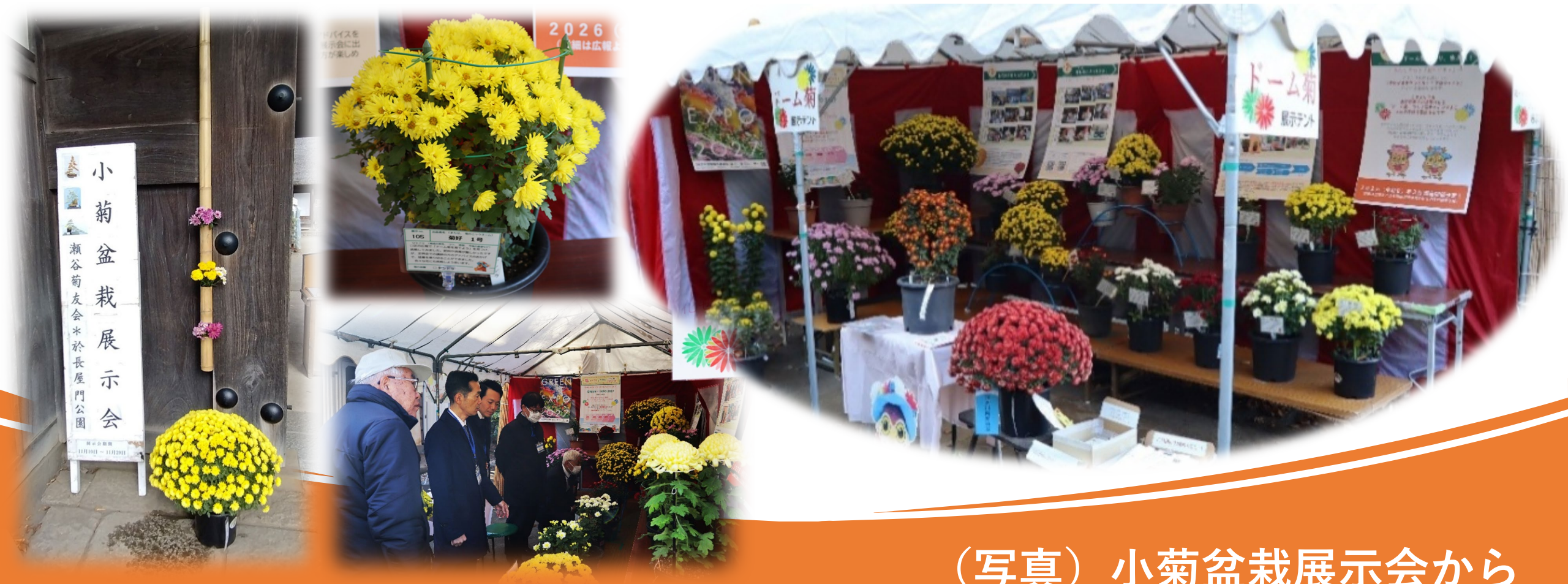
(写真) 小菊盆栽展示会から